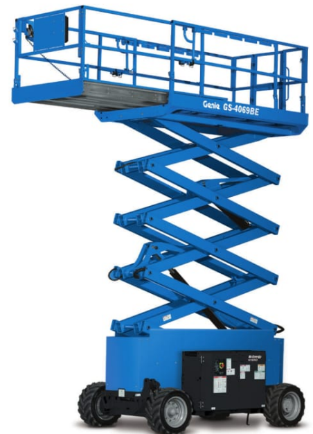
03/17 Ersatzteil Nr. B127304DE